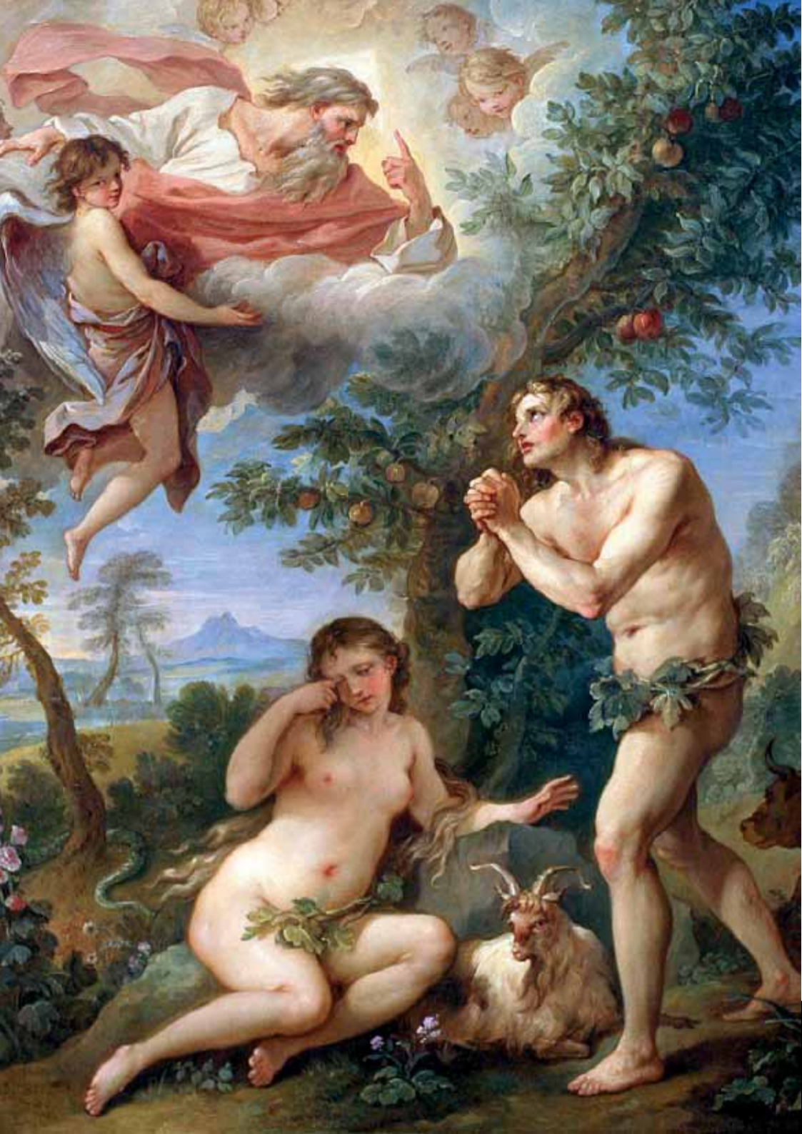
Motif: Kilian Krug, Berlin • Foto: © istockphoto.com/carza

Für Unterstützung danken wir der Stadt Luxemburg, dem Ministère de la Culture und dem Fonds Culturel National